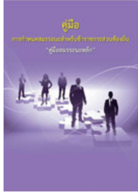
หนังสือ สมรรถะหลัก