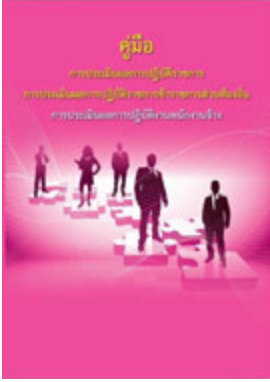
หนังสือ การประเมินผลการปฏิบัติงานพนักงานจ้าง