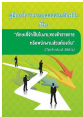
หนังสือ ทักษะที่จำเป็นในงานของข้าราชการ หรือพนักงานส่วนท้องถิ่น (Technical Skills)