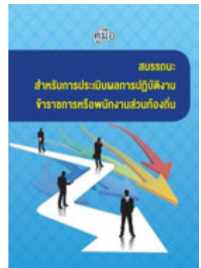
หนังสือ สมรรถนะสำหรับการประเมินผลการปฏิบัติงาน ข้าราชการหรือพนักงานส่วนท้องถิ่น