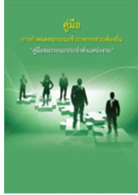
หนังสือ สมรรถะประจำตำแหน่งงาน