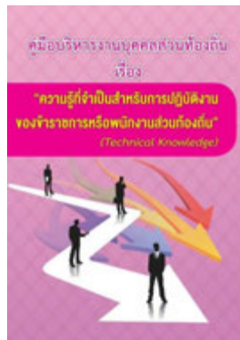
หนังสือ ความรู้ที่จำเป็นสำหรับการปฏิบัติงาน ของข้าราชการหรือพนักงานส่วนท้องถิ่น (Technical Knowledge)