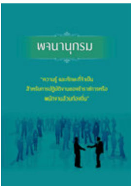
หนังสือ ความรู้ และทักษะที่จำเป็น สำหรับการปฏิบัติ งานของข้าราชการหรือพนักงานส่วนท้องถิ่น